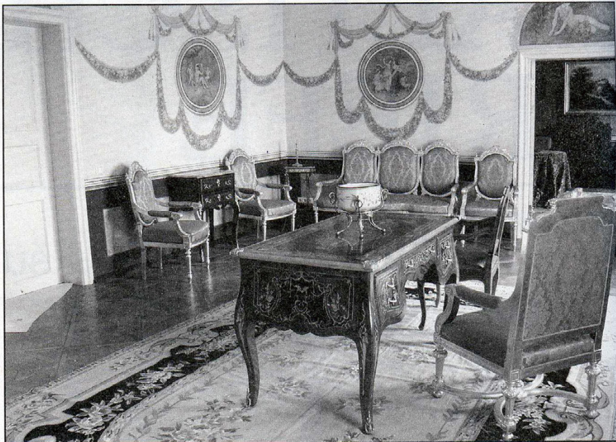
Blick in das Teezimmer

des. Besonders wichtig in diesem Zusammenhang waren vier Räume, die vollständig ausgemalt waren, sowohl an den Wänden, wie an den Decken. Fast vier Jahre hat es gedauert, diese Malereien freizulegen, zu konservieren und dann zu restaurieren. Dies alles geschah unter dem wachsamen Auge des Denkmalschutzes, der außerordentlich kooperativ und konstruktiv mitarbeiten konnte.