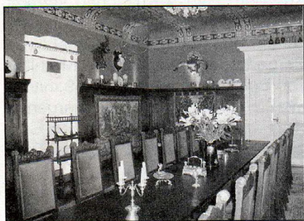
Blick in das Jagdzimmer

Im Jahr 2000 erwarb ein Hotelier aus Riga das Anwesen und begann langsam mit der Renovierung des unter Denkmalschutz gestellten Gebäu-